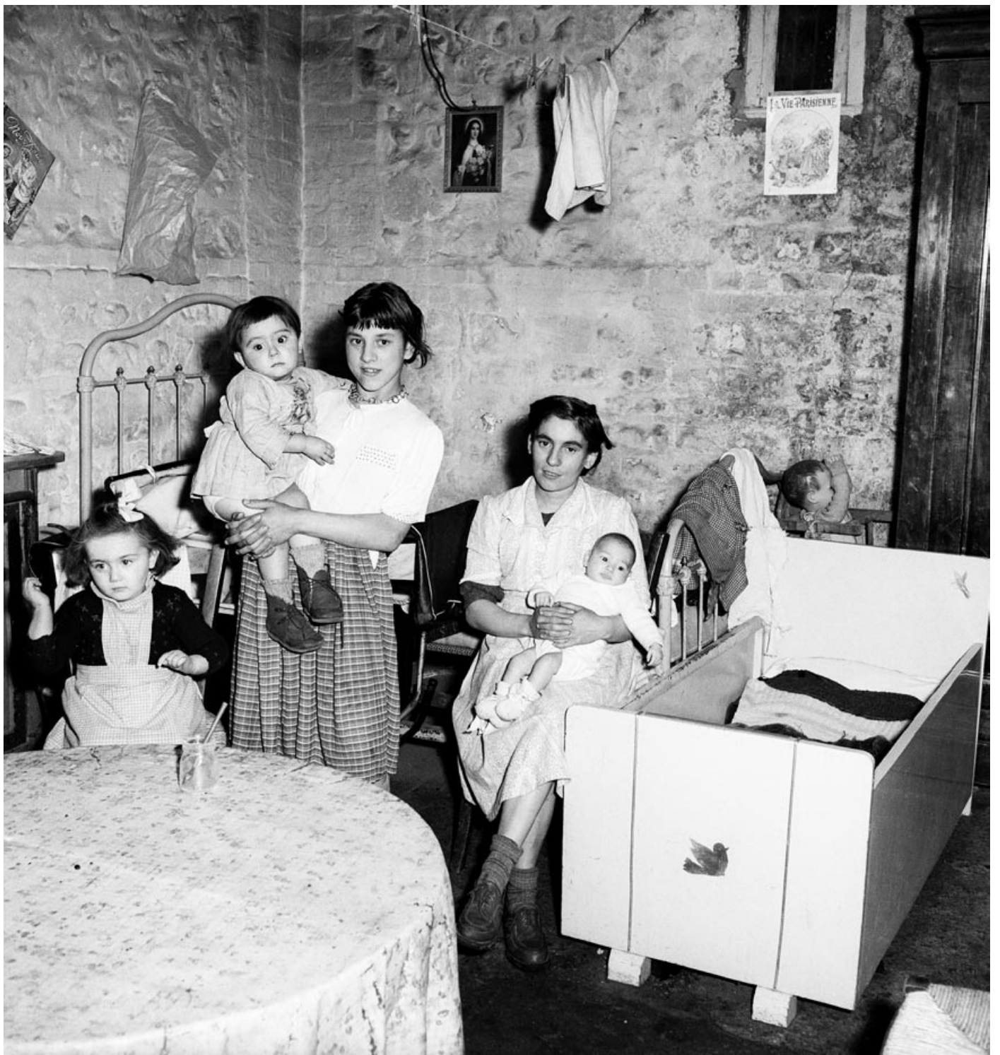
Petit-Quevilly, novembre 1952