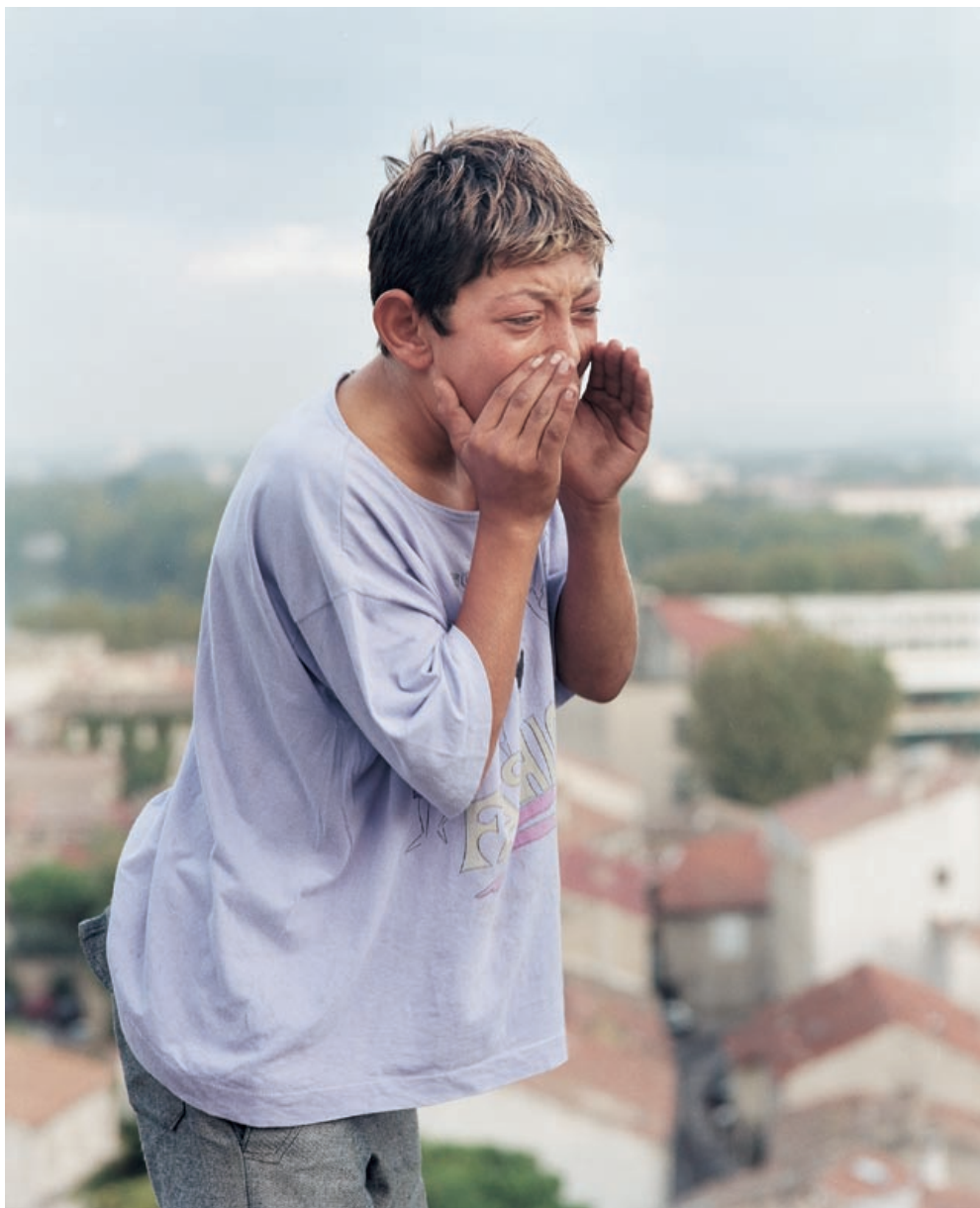
Image extraite de la série Les hurleurs, 2001 - 2004