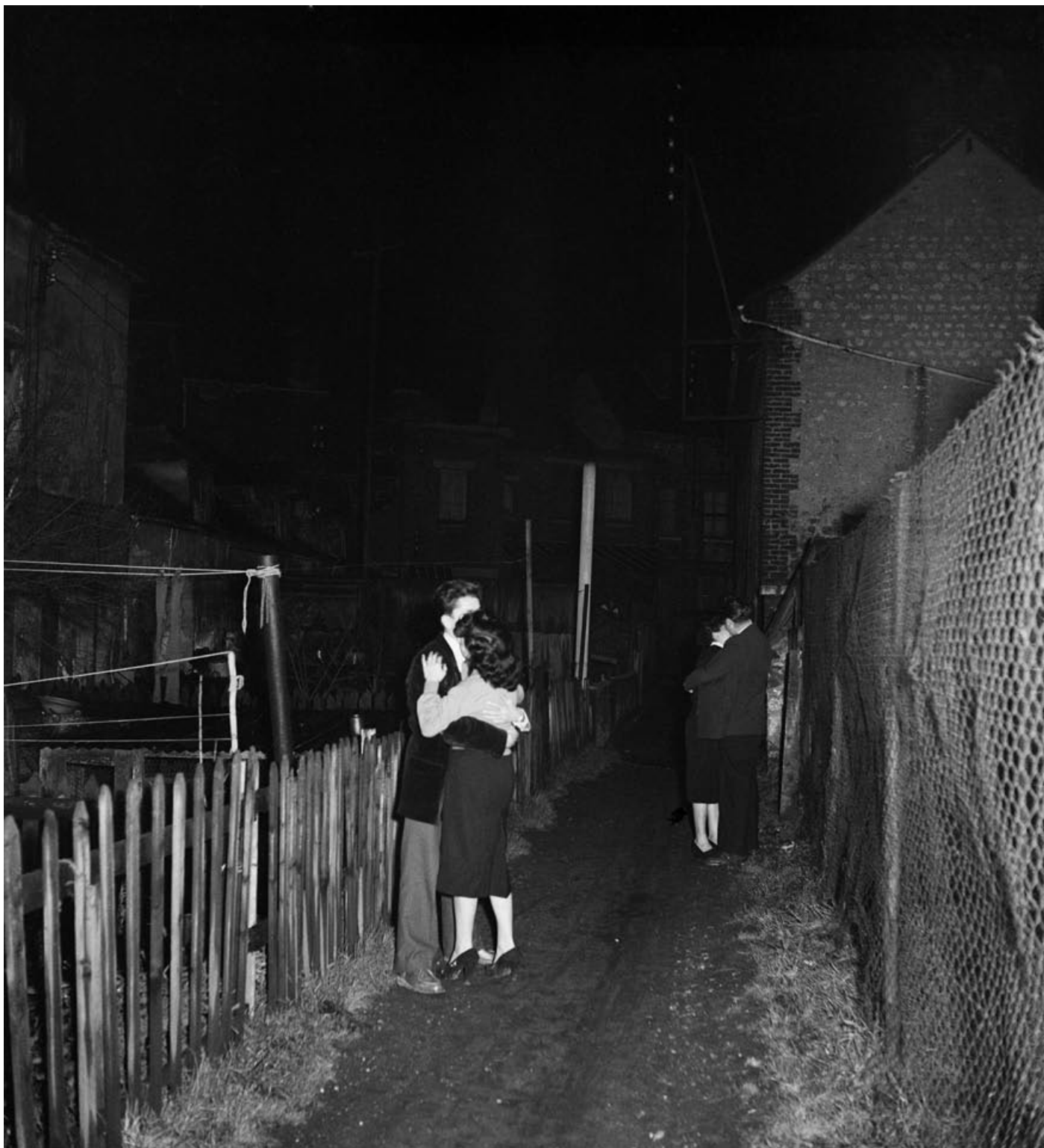
Petit-Quevilly, ruelle près du «Casino Rouennais» novembre 1952

L'exposition d'Henri Salesse est composée d'une centaine de tirages modernes, ainsi que d'une interview filmée de Didier Mouchel qui est à l'origine de la découverte de ce fond.