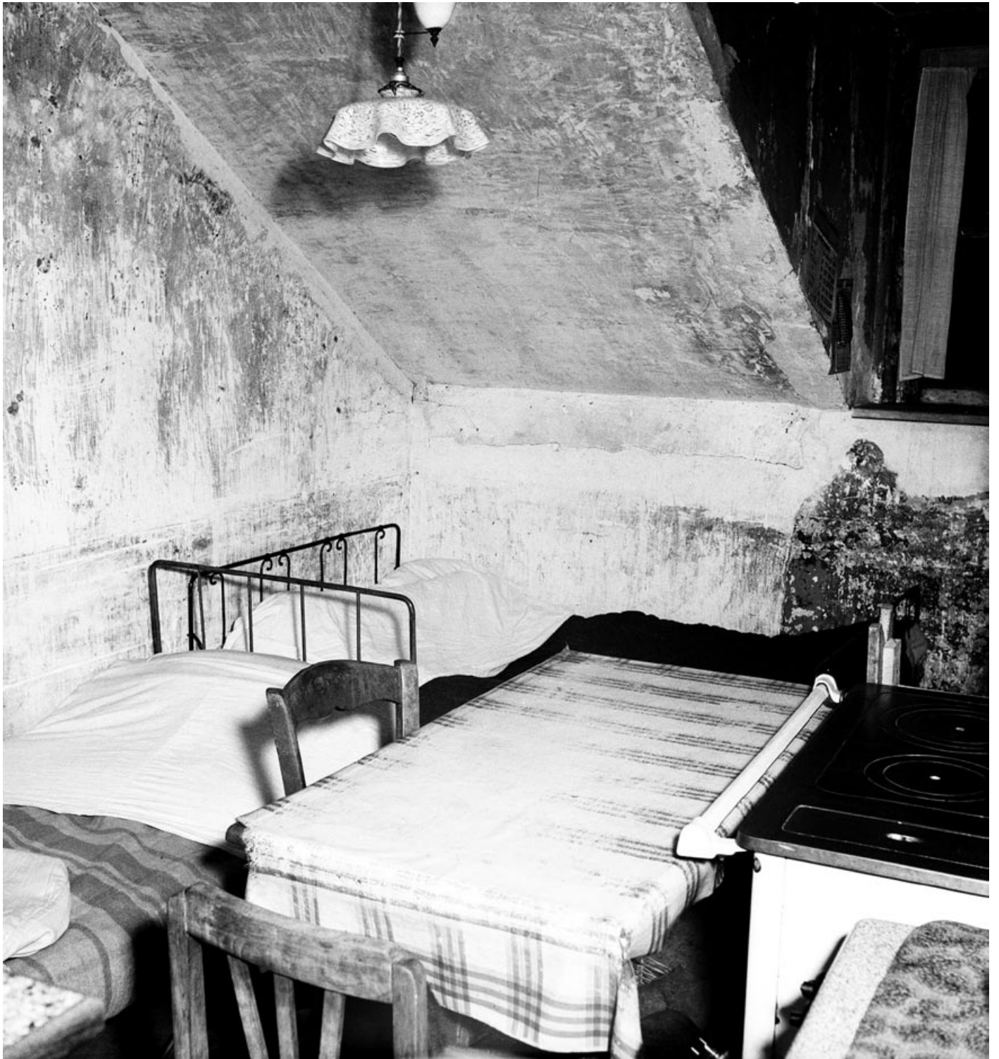
Petit-Quevilly, novembre 1952